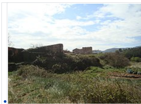
Torreta del Molinar