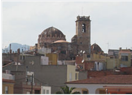
Església de Sant Miquel