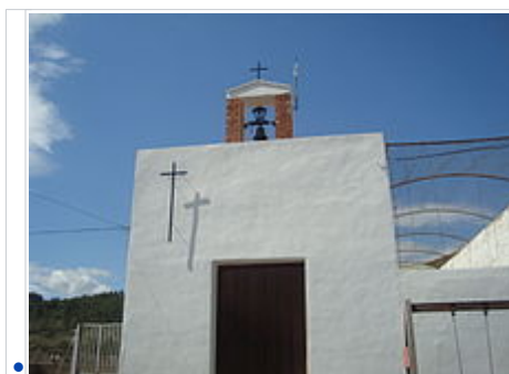
Capella de la Mare de Déu del Pilar d'Anroig (Xert)

Capella d'Anroig a la caseria d' Anroig .