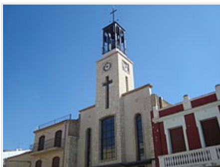
Campanar de l'Església Nova de Xert