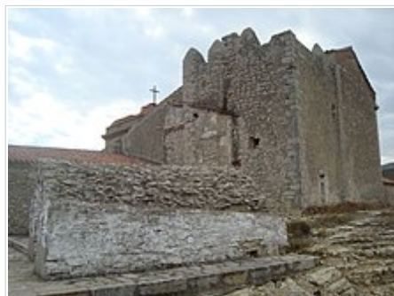
Torre i aljub de Sant Marc (Xert)

Torres. En el terme municipal de Xert es localitzen diverses torres de les quals disposava la població per defensar-se: torre d'En Molinar , torre Sant Marc , torre d'En Roig , torre de Pepo .