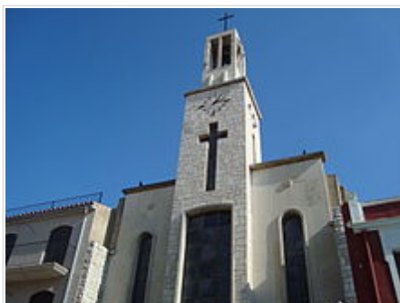
Campanar de l'Església de Xert

Des de 1984 s'han portat a terme treballs de restauració de l'edifici més emblemàtic de Xert. El Patronat Pro Restauració Església Vella de Xert va néixer amb aquest motiu i fins al moment ve gestionant-ne el procés de restauració ajudat per la pràctica totalitat d'habitants de Xert.