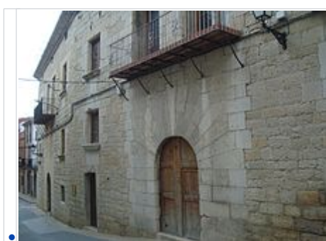
Palau dels Comtes de Pestagua (Xert)

Palau dels Comtes de Pestagua. És l'edifici civil més notable de la població. Els seus constructors i posseïdors van ser els Feliu, de Castelló de la Plana , una de les branques de la família que es va assentar en aquest poble en el segle XVII . Així ho prova mossèn Miguel Segarra en la seua Història eclesiàstica de Xert , que conta que eren uns "rics hisendats" que posseïen el patronatge d'una capella en "l'església Vella", amb dret a sepultura. Aquest edifici, venut per la família a principis del segle XX, es compon actualment de dues parts ben diferenciades: la situada al cantó del carrer València; la darrera, habitada per la comtessa de Pestagua, i adquirida pel farmacèutic del poble, fou coneguda com a "casa del metge Garcia" pel metge titular que va casar-se amb la filla d'aquell i hi va viure fins als anys 60. Actualment propietat d'una família valencianoasturiana, fou acuradament restaurada des dels anys 90. L'altra, propietat de la cooperativa agrícola Sant Marc, fou objecte d'importants obres de reconstrucció, encara no finalitzades, des de 2009, amb una subvenció de 500.000 euros de la Generalitat Valenciana. Tornada la façana i cos que dona al carrer València d'aquesta segona part a la seua antiga esplendor, després de les infortunades intervencions de dècades anteriors, està previst que allotge un contenidor cultural.