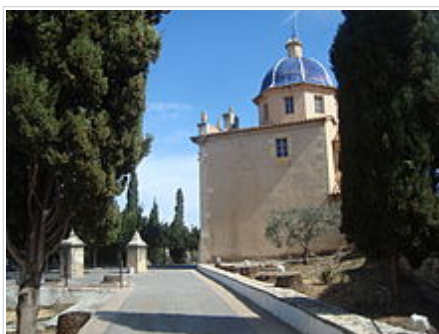
Ermita del Calvari de Vilanova d'Alcolea