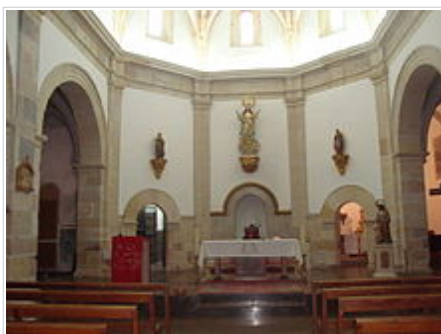
Interior de l'Església parroquial de l'Assumpció de la Mare de Déu