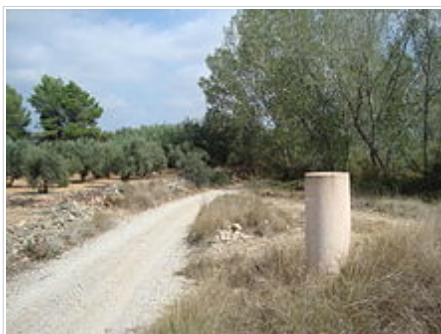
Via Augusta (Vilanova d'Alcolea)

Xop negre de l'Assut, Arbre Monumental de la Comunitat Valenciana (Vilanova d'Alcolea)