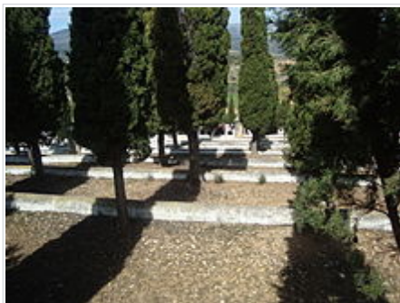
Recinte del Calvari de Vilanova d'Alcolea

En la vessant del pujol on s'assenta la població s'alça l'ermita del Calvari, amb capella a planta central que té pintures murals en l' absis , petxines en la cúpula i llunetes, obra del pintor Joaquim Oliet . En algunes fornícules de les estacions es conserva ceràmica d' Onda i l' Alcora del segle XVIII.