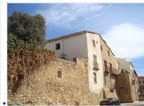
Muralles de Vilanova d'Alcolea

• L'Hostalot . En 1992 va ser descobert en la partida de l'Hostalot, el jaciment d' l'ldum , estació romana de la província, on s'han trobat importants restes arqueològiques, entre altres un mil·liari en bon estat de conservació. Actualment restaurat i visitable.