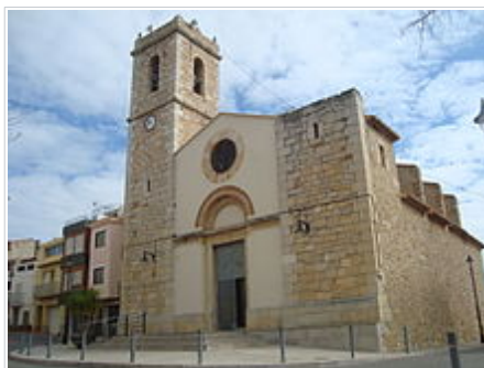
Església parroquial de Santa Quitèria (La Torre d'en Doménec)

• Ermita de la Mare de Déu de la Font del segle XIV , destaca la imatge de la Verge, de 32 centímetres, trobada pels veïns del poble, que destaca per portar el xiquet al braç dret i perquè es van trobar restes d'or en la seua corona. La verge es destruï l'any 1936 a trossets, i fou reconstruïda pels veïns del poble.