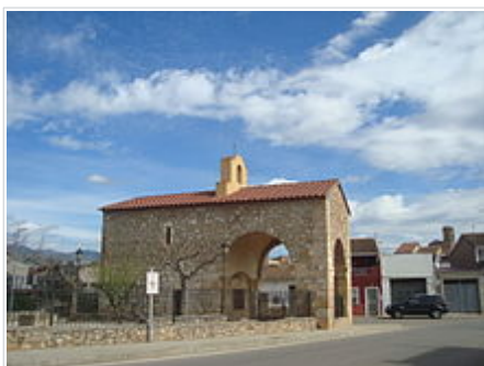
Ermita de Loreto