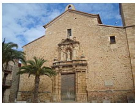
Església de Sant Bartomeu (Vilanova d'Alcolea)

Església amb altar barroc del segle XVII, obra dels Germans Capuz. És de tres naus sense creuer ni cúpula, d'escassa ornamentació, però de proporcions cuidades, com ho és també la bella portada de tipus clàssic de 1700 . La capella té cúpula i bona decoració barroca. Harmònic de proporcions i de bona presència és el campanar, en particular el seu cos superior de les campanes. Conserva algunes peces d'orfebreria, entre elles un calze del segle XVI amb punxó valencià.