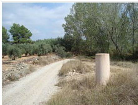
Via Augusta (Vilanova d'Alcolea)

Xop negre de l'Assut, Arbre Monumental de la Comunitat Valenciana (Vilanova d'Alcolea)