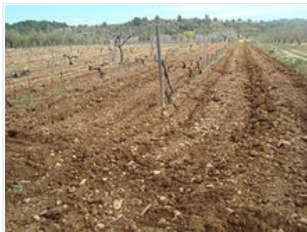
Camp de vinya, agricultura de secà (La Torre d'en Doménec)

Basada tradicionalment en l' agricultura de secà , especialment ametlers i oliveres . Destaquen també els bancals de cirerers .