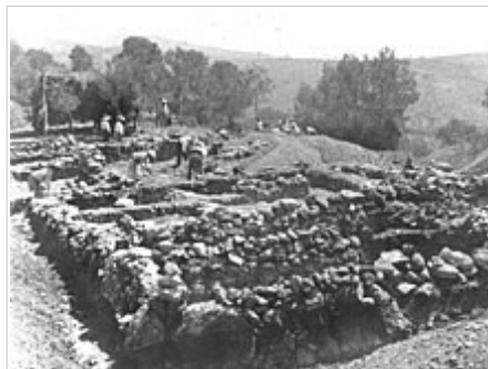
Excavacions a la Bastida de les Alcusses l'any 1928