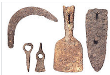
Instrumental agrícola de la Bastida de les Alcusses

Les tasques agrícoles i ramaderes eren part fonamental per al manteniment quotidià. Els principals cultius eren els cereals de secà -ordi, blat i mill- i les lleguminoses -faves i pèsols-, als quals se sumava el cultiu de fruiters com l'olivera, la vinya, l'ametller i la figuera. Aquests cultius es realitzaven amb arades de fusta reforçades amb peces de ferro que anomenem reixes , que han estat recuperades en un bon nombre en les cases de la Bastida. Això permetia extreure molt de rendiment en treballar zones de terres dures o difícils. Altres eines agrícoles presents a les cases són podalls, falçs, llegones i agullades, que en conjunt ofereixen la millor i més completa selecció d'eines agrícoles d'època preromana conegudes fins ara a l'Estat espanyol.