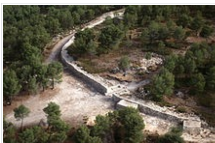
Muralla i Porta Oest del poblat

La Bastida és un poblat de 3,5 hectàrees amb una muralla de més de tres metres d'amplada en les zones més accessibles, i per tant més vulnerables. A més, hi ha dues torres adossades a la muralla per a millorar-ne la defensa. Hi ha un altre recinte més estret situat a la part més accessible del poblat, a la zona oriental, que està inacabat i que es realitzaria per reforçar el control dels accessos. Aquest segon recinte defineix un espai d'1,5 hectàrees.