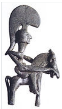
Guerrer de Moixent (7,3 cm) descobert el 1931 per l'obrer Vicente Espí, [10] en el departament 218

Els treballs i tasques realitzats defineixen els grups que van habitar la Bastida. Camperols, comerciants i artesans conviuen amb altres grups l'activitat més visible dels quals és la guerra. Els guerrers més destacats van haver de ser cavallers, com el de la coneguda figura de bronze del Guerrer de Moixent. En aquesta peça, un home nu és representat amb els elements específics de la classe dominant: les