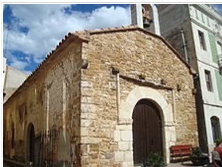
Ermita dels Sants Joans