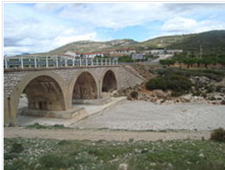
Pont de Vilar de Canes sobre la Rambla Carbonera

La seua superfície està solcada pels barrancs d'En Seguer, de la Teuleria i de la Frescor i per la Rambla Carbonera . Les principals altures són la serra de Foies, el Tossal Redó i el Maxorral. El paratge més freqüentat és el brollador de La Font del Mas del Senyor. Els vilarins viuen molts dispersos, al poble i als masos: La Segarreta, La Segarra, L'Hostal de l'Esquerrera, el mas d'en Romeu, el mas del Senyor, el Solar, el mas de les Cogullades, la Pallissa, el Cap del Moro, etc.