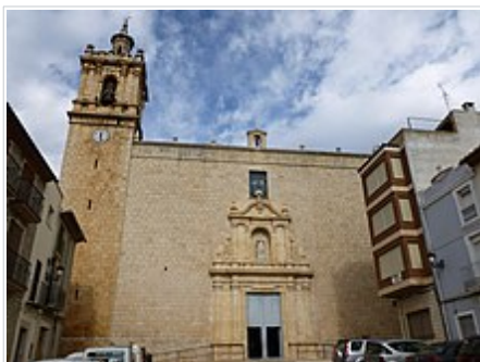
Església parroquial de l'Assumpció