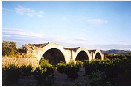
Pont del Rei