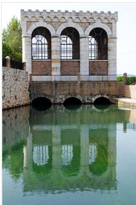
Casa de les Comportes