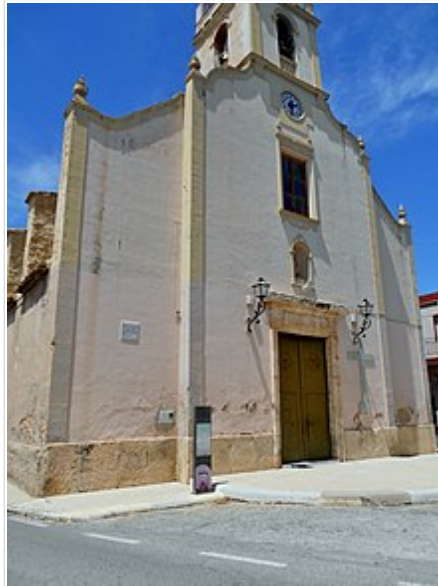
Església de Gavarda