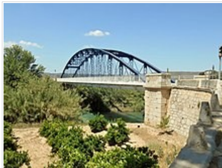
El Pont de ferro

• Església de Sant Joan Baptista i Sant Antoni. L'Església parroquial del nucli antic de Gavarda va ser construïda en 1870 . És d'una sola nau amb capelles laterals. Destaca damunt de la portada una torre rematada per una monumental escultura del Sagrat Cor de Jesús.