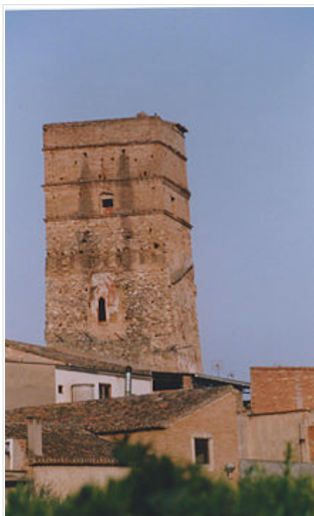
Torre àrab d'Antella