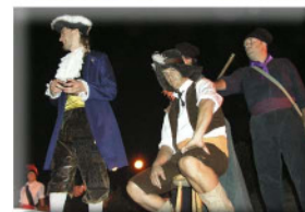
Tocassons a Taradell