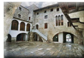
Abadia de Breda