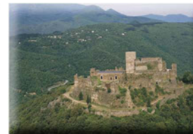
Castell de Montsoriu