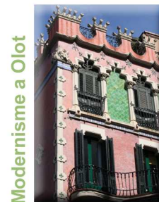
Modernisme a Olot

Cingleres basàltiques (Brancal de l'Alta Garrotxa) , de Sant Joan les Fonts a Castellfollit de la Roca: 9,3 Km.